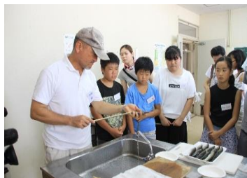
8月「水の恵みを学ぶ食育教室」