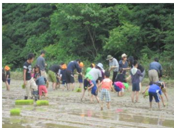
5月「田植え体験と食育教室」