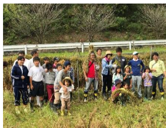
9月「稲刈り体験と食育教室」