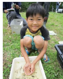
6月「いきものみっけ」