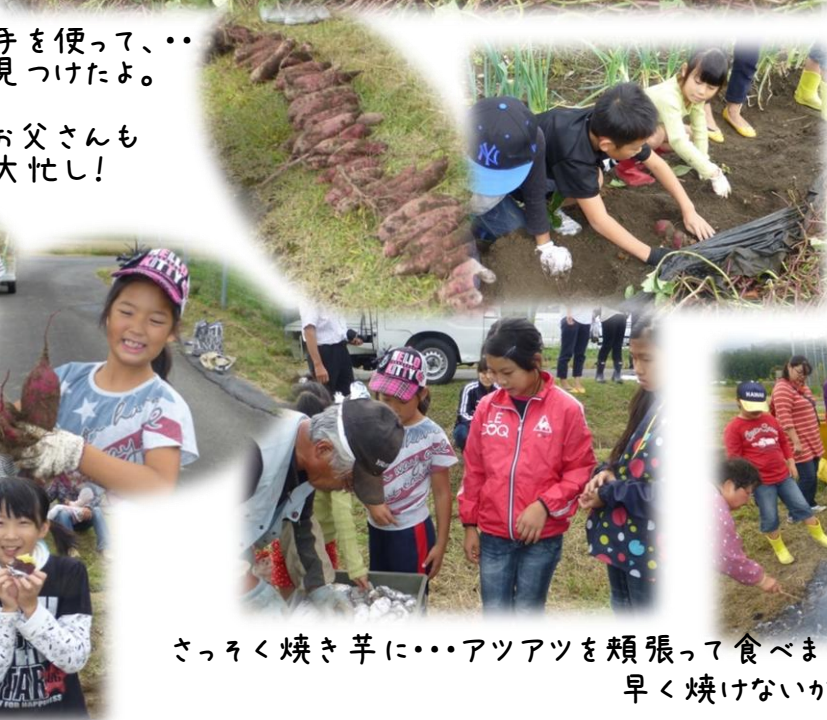
さつそく焼き芋に...アツアツを頬張って食べました。 早く焼けないかな.....